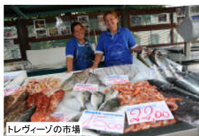
トレヴィーゾの市場