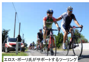
エロス・ポーリ氏がサポートするツーリング