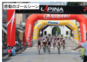
感動のゴールシーン