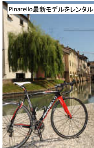
Pinarello最新モデルをレンタル