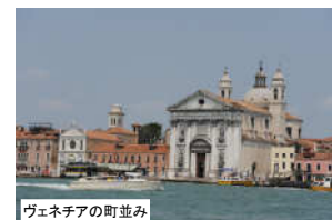
ヴェネチアの町並み