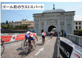
ゴール前のラストスパート