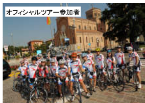
オフィシャルツアー参加者

燃油サーチャージ目安額43,000円・羽田空港施設使用料2,570円・現地空港諸税約3,500円が別途必要となります。 ※いずれも2014年3月25日現在料金 ラ・ピナ サイクリングマラソンのエントリー費用55ユーロ(概算7,900円/2014年3月20日現在)とエントリー代行手数料500円が別途必要となります。