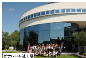
ピナレロ本社工場