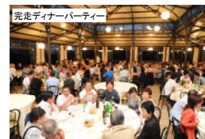
完走ディナーパーティー