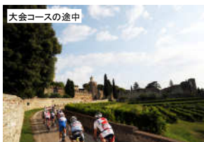
大会コースの途中